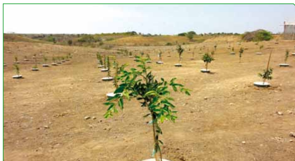
CITRONTRÆER I ECUADOR