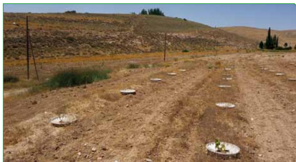
UNGE PLANTER I JORDAN