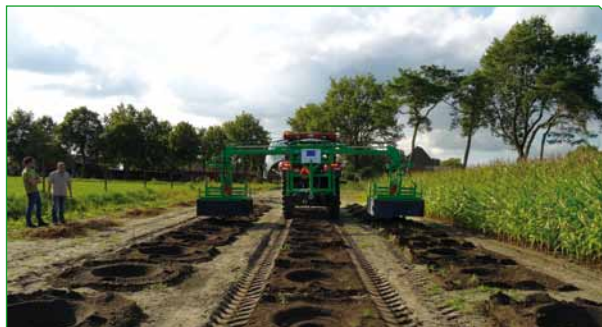
JORDEN KLAGØRES TIL WATERBOXXENE