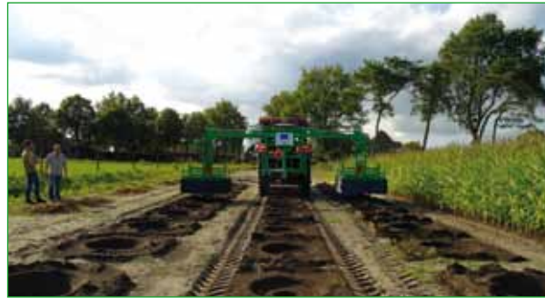
VORBEREITUNGEN ZUM EINSETZEN DER WATERBOXX