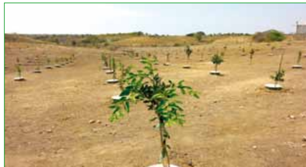
ZITRONENBAUM IN ECUADOR