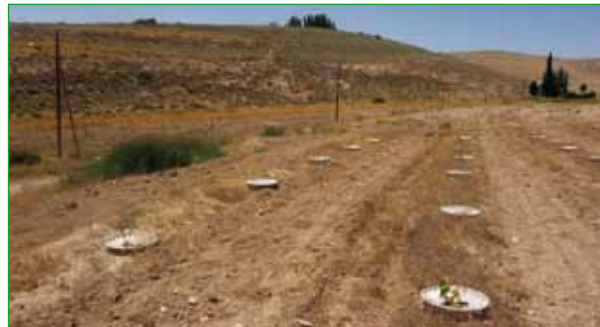
JUNGE PFLANZEN IN JORDANIEN